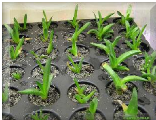
Aklimatizace probíhá bez ztrát. Po týdnu stagnace je patrný rychlý růst.