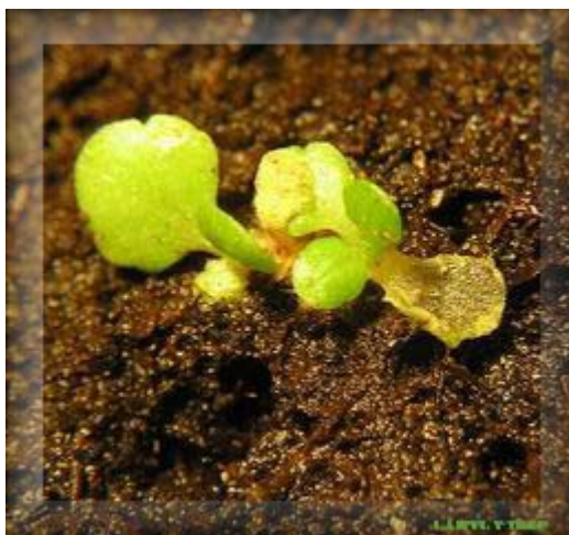
Odumření agarových lístků a růst nových již plně funkčních.

Problém, se kterým se rostliny musí vyrovnat, je přechod ze situace, kdy ač jsou schopné částečné fotosyntézy, potřebují k vývoji i organické látky, do stavu, kdy jsou plně autotrofní. Tedy kdy zdrojem uhlíku bude oxid uhličitý a světlo dodá energii. Cukry v médiu brzdí fotosyntetický aparát a při převodu rostliny do in vivo podmínek je nutné, aby si postupně vyrovnávala uhlíkovou bilanci. U některých rostlin dochází k tvorbě odlišné vnitřní struktury listu, k nedostatečně vyvinuté vrstvičce /kutinu/, která pokrývá vnější strany pokožkových buněk a zabraňuje ztrátám vody a bývají problémy i s funkcí průduchů. Při vytvoření nových, již plně funkčních listů, můžou listy původní opadnout za okolností, kdy vlastně plnily pouze funkci zásoby organických látek.