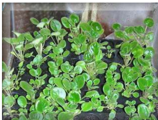
Již aklimatizované rostliny .

Při vylahvení rostlin je nutné velmi pečlivě a důsledně odstranit zbytky média, koupeme v heřmánku, sprchujeme vlažnou vodou. Zbytky média pro svůj obsah cukrů a vitamínů by byly zdrojem plísní a i v této fázi by mohly kulturu zmařit. Po přesazení do substrátu můžeme v určitých případech použít i slabé koncentrace hnojiva a fungicidů.