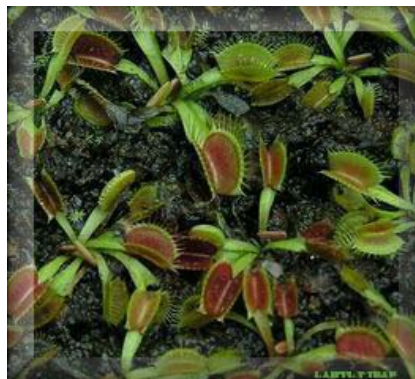
Převod do substrátu takto vyplávané krasavice je stoprocentní.

Izolováním jednotlivých rostlin a přesazení pouze na médium růstové s požadovanou minerální výživou při stejné fotoperiodě, ale s vyšší intenzitou osvětlení. Rostliny v této fázi přestanou odnožovat a soustředí se pouze samy na sebe. Teprve po dvou - třech týdnech převádím rostlinu již dostatečně silnou do substrátu, ale stále v řízených podmínkách teploty a fotoperiody. Zde je nutné minimálně čtrnáct dnů postupně přivětrávat a snižovat tak vzdušnou vlhkost na požadovanou hodnotu. V další fázi otužování bude na řadě světlo. Pokud další cesta povede do skleníku nebo na parapet, je nutné silně stínit a přivykat slunci také velmi opatrně. Pod zářivkou naměříme 2 000 - 4 000 lx, ale když sluníčko vykoukne z mraků luxmetr vyskočí na 70 000 lx a výše. To je pro list šok, který lze přežít jen velmi obtížně.